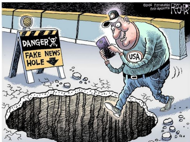
Rob Rogers, Pittsburgh Post-Gazette / Courtesy of AAEC

Disponível em: https://floridafinancialliteracy.weebly.com/blog/fake-news-political-cartoon - acesso em 14/10/2018.